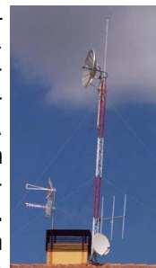
Radio en lace R. Sintonía

107'3 R. SINTONÍA ALIJA DEL INFANTADO-ALIJA DEL INFANTADO, (nueva municipal) debe de ser del mismo dueño de R. SINTONÍA de Milles de la Polvorosa (Zamora) por las cuñas pero emite diferente música. Tiene mucha potencia pues llega desde Astorga hasta Villalpando. Por las noches conectan con FORMULA HIT. (JCG) [ Ayuntamiento, Plaza mayor s/n, 24761-Alija del Infantado. Efectivamente algo tiene con ver con R. Sintonía Milles de la Polvorosa (Zamora) pues en su Web viene ambas frecuencias y emisoras http://users.servicios.retecal.es/radio-sintonia/ ]